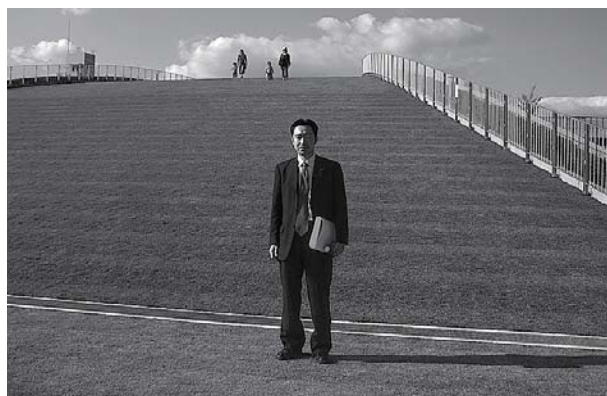
▲かごしま環境未来館(緑化屋上)

公共施設がさらに緑化されます! ヒートアイランド現象緩和のため、緑のカーテンなどによる緑化の効果も期待されております。 そこで、特に昨年の決算特別委員会において、区内の緑化を一層促進するために、区民の皆様の目につきやすい区役所本庁舎などに緑のカーテン及び屋上緑化を進めていくべきであると提案させて頂きました。 平成21年度は、区役所本庁舎、中央会館(銀座)、ロッセサム、浜町集会施設(仮称)、明石町区民館、十思保育園、久松小学校、月島第一小学校に壁面緑化や屋上緑化が整備され、次年度以降も区内の公共施設が順次緑化される予定です。