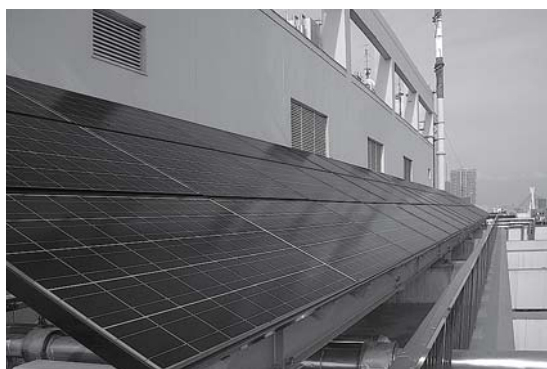
▲太陽光発電システム(中央区役所)