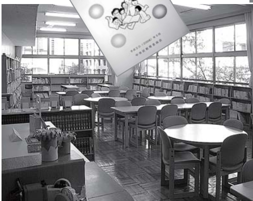
▲京橋菜地小学校の学校図書館

「中央区子ども読書活動推進計画」に基づき、学校図書館図書データのデータベース化を2カ年で、区立図書館とのネットワークが充実されます。