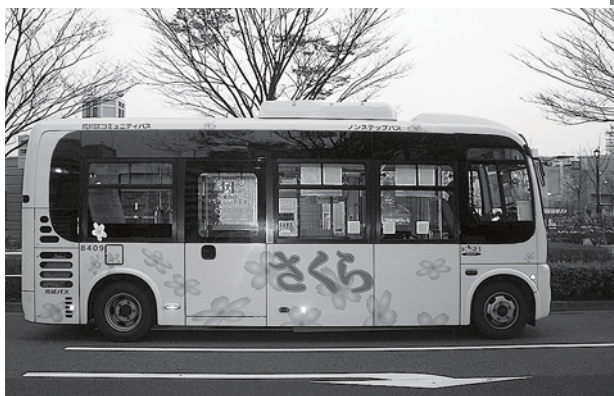
▲荒川区のコミュニティバス「さくら」

尚、平成21年11月まで試験運行等がありますので、計画内容が変更する可能性があります。