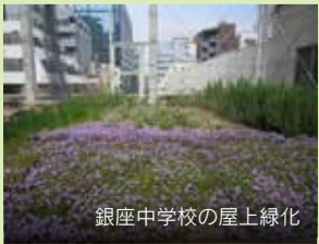
銀座中学校の屋上緑化