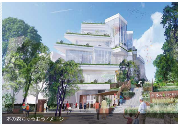
本の森ちゅうおうイメージ