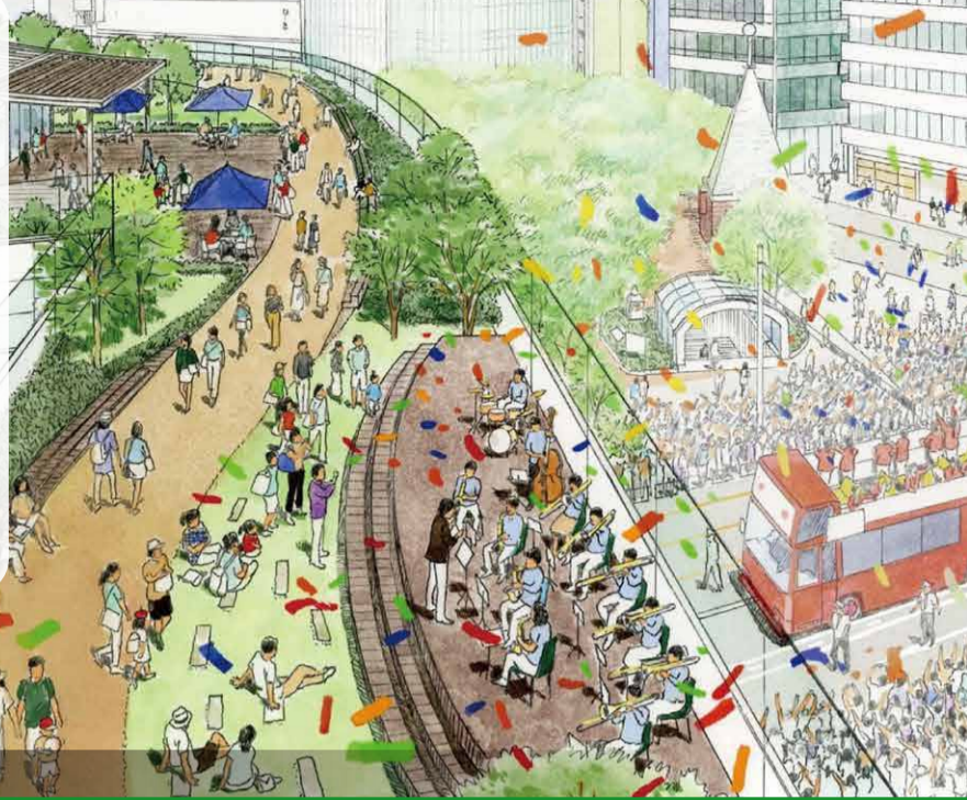
東京高速道路(KK線)の将来構想図

昨年の「築地川アメニティ整備構想」で示した銀座、築地のまちをつなぐ新たな緑の空間の創出と合わせ、今年度は東京高速道路(KK線)を活用した銀座地区外周の緑のプロムナード化に向けた検討を行います。