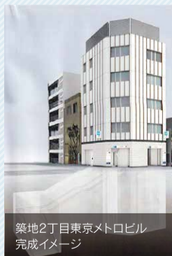
築地2丁目東京メトロビル 完成イメージ

2019年12月21日に、聖路加国際病院方面出入口にエレベーターが開設されました。そして、現在築地警察署方面出入口付近において、エレベーターとトイレが2022年度に整備される予定です。