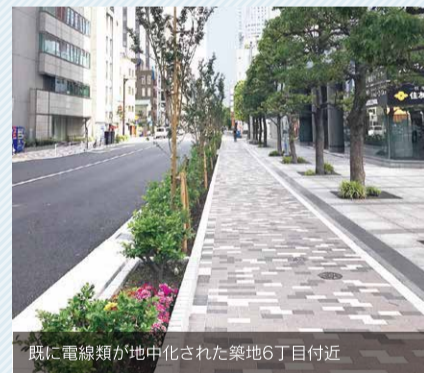
既に電線類が地中化された築地6丁目付近

新たな整備道路として、今年度は築地6丁目4番先から明石町12番先において詳細設計が行われます。