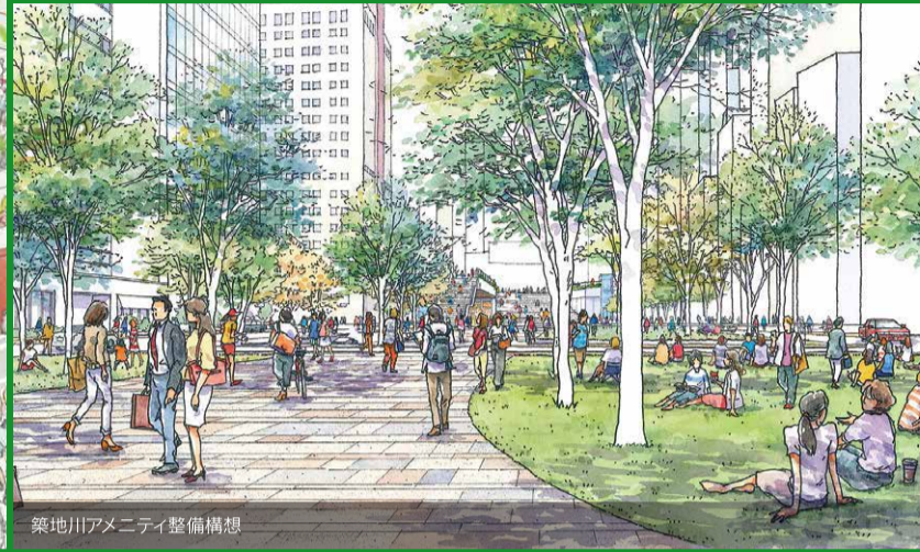
築地川アメニティ整備構想