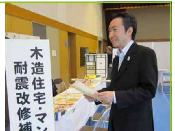
地域防災フェアに参加(6月2日)