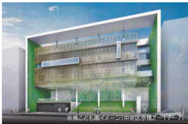
京橋こども園イメージ(中央区京橋2-17-7)