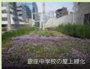
銀座中学校の屋上緑化