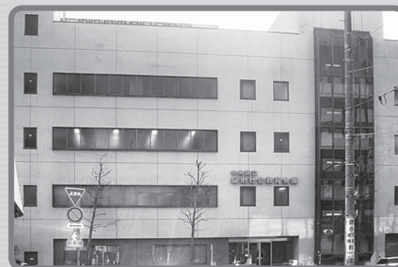
▲築地社会教育会館