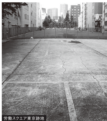
▲労働スクエア東京跡地