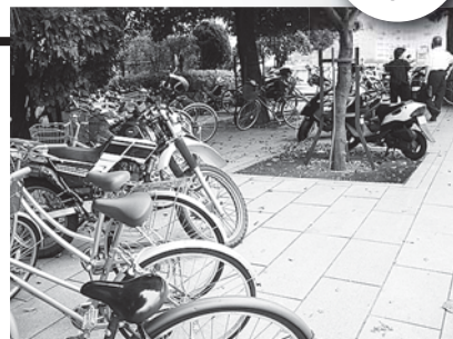
▲整備以前の「憩いの場」

地元町会長さんのご指導を賜りながら、地域の方々のご協力を頂き「憩いの場」となるよう推進しました。