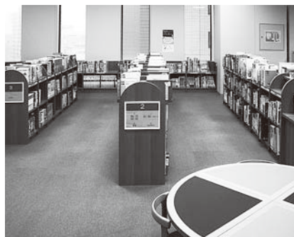
▲平成19年9月11日千代田図書館を視察